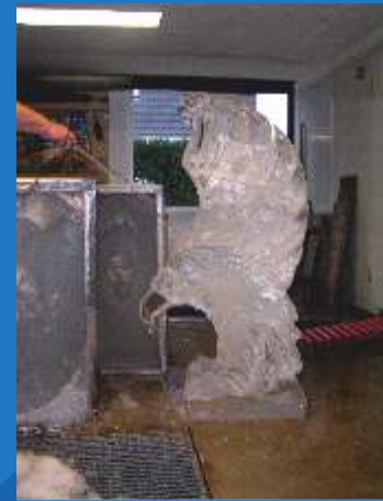
na jarenlang onderzoek en experimenteren kunnen wij transparante ijsblokken fabriceren